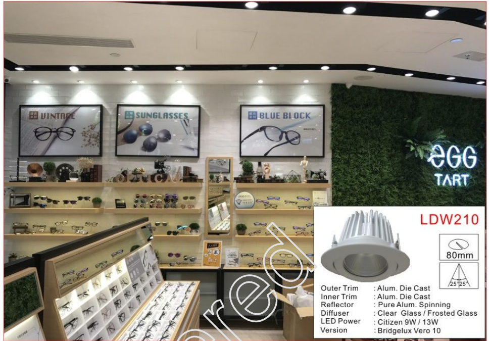
使用小型中角度800流明，用於櫥窗，海報，洗牆照明