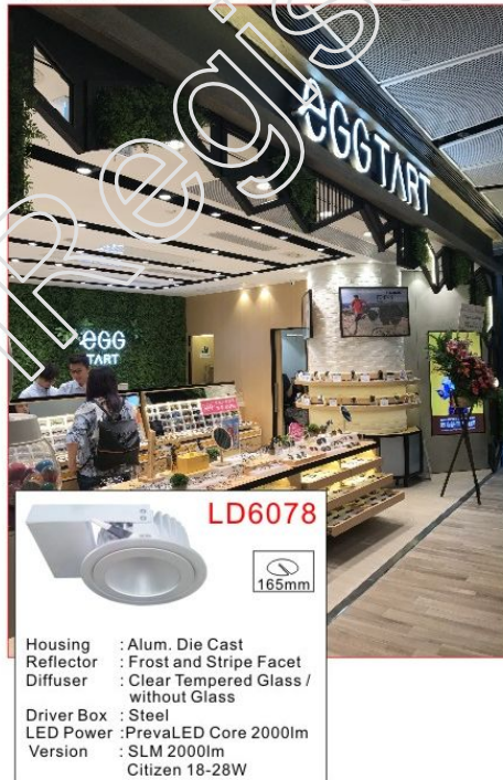
主櫥窗使用中角度特顯推廣項目及吸引路人眼光