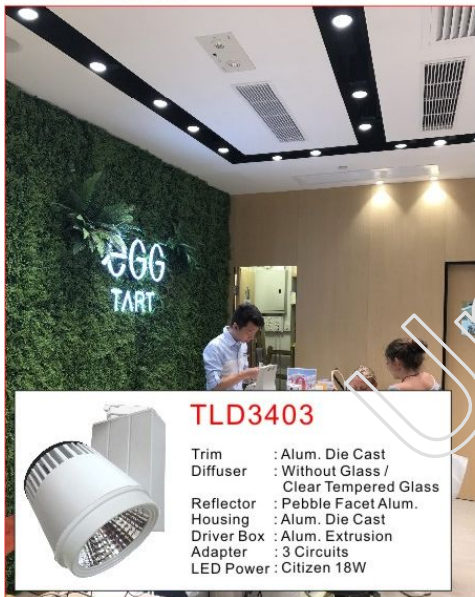
2000流明3500K高顯LED技術為主要照明