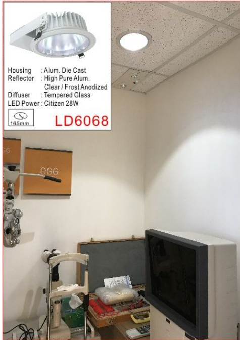
驗光室 ( 1500流明0-10V調光 )